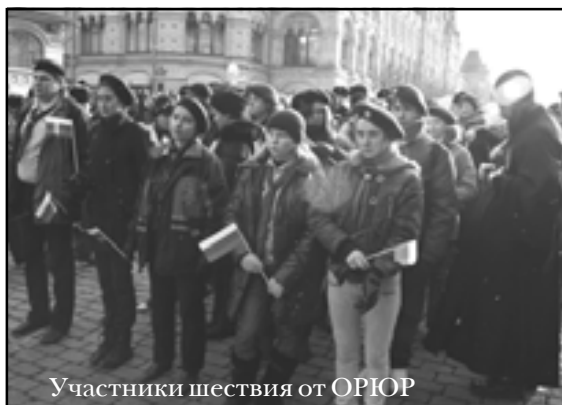
Участники шествия от ОРЮР

Далее юные разведчики приняли участие в VIII церковно-общественной выставке-форуме «Православная Русь» в Манеже, которая длилась с 4 по 8 ноября. В первый день Выставки на встрече Патриарха Кирилла с молодежью разведчики сделали презентацию Организации, все дни раздавали газету «Скаутский мир» с буклетом ОРЮР, общались с духовенством и всеми, кто интересовался Разведчеством.