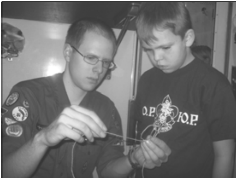
Фото зимней экспедиции дружины «Крутицкий вертоград» в Екатеринбург — Алапаевск — Тобольск, 1–11 января 2009 г.