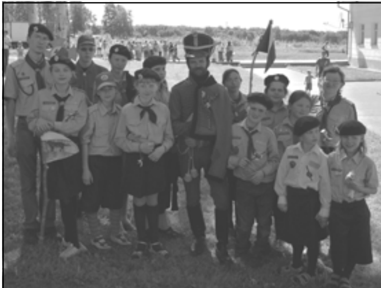
Бородино. Май–июнь 2009 г. Фото бивуака дружины «Крутицкий вертоград»

мог наблюдать одну характерную черту русского человека, которую довольно редко находишь у шведов. Я говорю про выносливость и терпеливость. Шведы часто жалуются, когда обстоятельства их не устраивают, тогда как русские в большей степени сохраняют спокойствие. По моему мнению, это положительное качество.